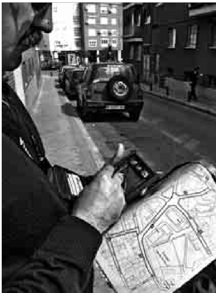
Un vigilante controla la zona SER en Fuencarral.

fras, calculadas en función de toda una jornada de 24 horas. En el Norte (Costa Rica, por ejemplo) la bajada ha sido del 2,7%. El punto menos sensible a los efectos del SER ha sido el Sur: el tráfico se ha reducido, en lo que a entradas al centro se re-