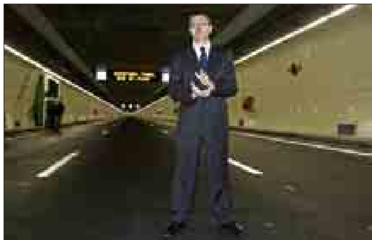
El alcalde de Madrid, Alberto Ruiz-Gallardón, ayer, en el túnel.

ahora se han convertido en ganadores de verdad».