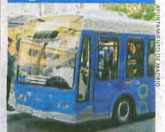
El autobús, en marcha.