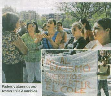
Padres y alumnos protestan en la Asamblea.